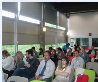
Međunarodna konferencija u Strasbourgu – građansko sudjelovanje i volontiranje u Europi