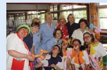
Klaunovi-volonteri u posjetu dječjem odjelu sisačke bolnice