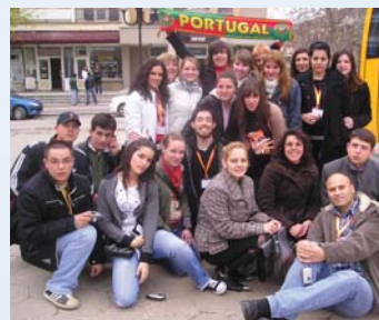
Međunarodna razmjena mladih u Bugarskoj