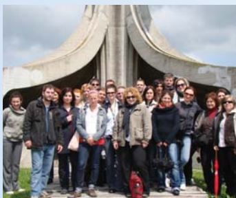
Građani u obilasku Spomen područja Jasenovac