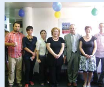
Otvaranje Lokalnog volonterskog centra Sisak