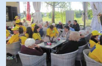
Prekogranični volonterski kamp u Sisku – šetnja i kava s korisnicima Doma za stare i nemoćne osobe