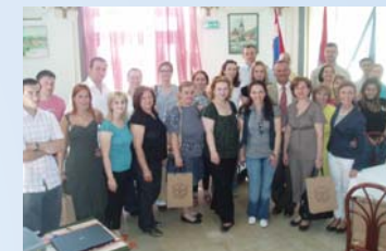
Studijska posjeta Hrvatskoj Kostajnici u okviru međunarodnog projekta bratimljenja gradova