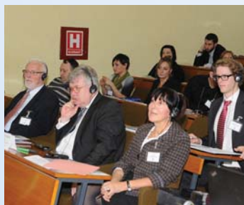
Veleposlanici Norveške i Belgije i Predsjednik ALDA-e na međunarodnoj konferenciji povodom 15 godina rada ALD Sisak