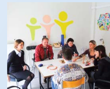
Studijska posjeta naših volontera nevladinim organizacijama u Grčkoj