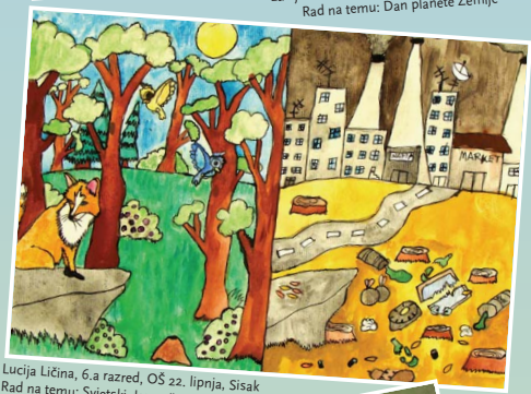
Lucija Ličina, 6.a razred, OŠ 22. lipnja, Sisak Rad na temu: Svjetski dan zaštite okoliša