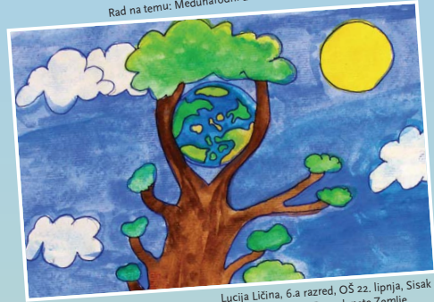
Lucija Ličina, 6.a razred, OŠ 22. lipnja, Sisak Rad na temu: Dan planete Zemlje

5. 12. Međunarodni dan volontera 10. 12. Međunarodni dan ljudskih prava