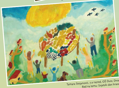
Tamara Stojanović, 7.a razred, OŠ Dvor, Dvor Rad na temu: Svjetski dan hrane