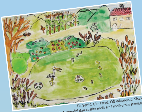
Tia Sertić, 5.b razred, OŠ Viktorovac, Sisak Rad na temu: Međunarodni dan zaštite močvare i močvarnih staništa