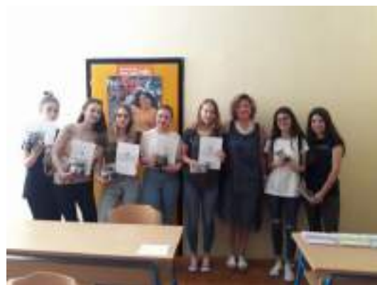
Učenicе Gimnazije Sisak dobitnice nagrade za Naj-video kojim se promovira volontiranje srednjoškolaca

Projekt je sufinancirao Ured za udruge Vlade Republike Hrvatske