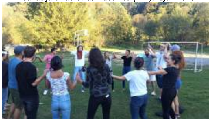
Edukacija o liderstvu, Vlasenica (BIH), rujan 2018.