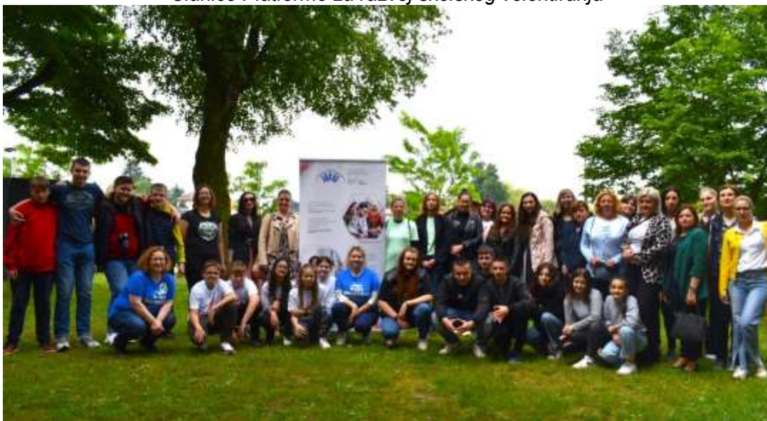
Članice Platforme za razvoj školskog volontiranja

Projektom se objedinjuje višegodišnja praksa i trud ALD Sisak i obrazovnih ustanova s područja Sisačko-moslavačke županije u području razvoja školskih volonterskih klubova kroz uspostavu Platforme za razvoj školskog volontiranja kao mjesta edukacije, razmjene i zagovaranja prema donositeljima odluka. Projektom se želi stvoriti preduvjet za sustavnu podršku školama u SMŽ kako bi ojačali svoje kapacitete za razvoj i provedbu praktičnih i angažirajućih sadržaja na teme aktivnog građanstva, socijalne pravde i društvenog uključivanja. Platformu čine škole u kojima volonterski klubovi postoje te one škole koje su zainteresirane za razvoj takve vrste izvanškolskih aktivnosti. Okosnica rada školskog volonterskog kluba je suradnički (ko-kreatorski) rad nastavnika i učenika u detektiranju potreba i problema u zajednici, iznalaženja najboljih rješenja te provedba konkretnih volonterskih akcija učenika.