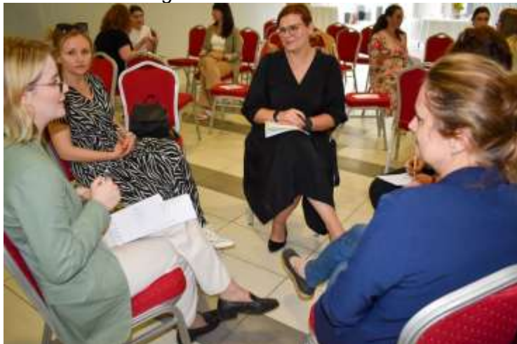
Regionalna radionica u Sisku

Osnovne projektne aktivnosti odnose se na: izradu metodologije praćenja Europskog stupa socijalnih prava u Hrvatskoj; analizu relevantnih EU i nacionalnih socijalnih politika, propisa i praksi; provedbu empirijskog istraživanja s ciljem dobivanja uvida u percepciju ključnih dionika u području ESSP-a; regionalne edukacije; pružanje podrške partnerskim organizacijama za izradu analiza i praćenje te utjecaj na ESSP politike na lokalnoj razini; izrada priručnika za socijalnu integraciju ranjivih skupina u statusu stambene isključenosti s posebnim naglaskom na stanovanje ranjivih skupina (19. stup ESSP) te završna konferencija projekta.