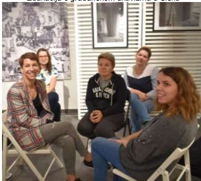
Edukacija o građanskom aktivizmu u Sisku

Projekt doprinosi rješavanju problema s kojima se manje i slabije kapacitirane udruge nose u svom svakodnevnom poslovanju kao i nošenju s kriznim situacijama u lokalnoj zajednici. Razvijen je i proveden sveobuhvatan program jačanja kapaciteta OCD-a za rad u kriznim situacijama te za rad na daljinu, a u kojem je sudjelovalo 208 zaposlenika i volontera udruga iz Hrvatske. Program je obuhvatio 17 različitih tema za uspješan rad i razvoj novih vještina, a uključio je područja: učinkovito organizacijsko planiranja, upravljanje volonterima u kriznim situacijama, građanski aktivizam, razvoj Internet stranica, upravljanje društvenim mrežama, javna nabava, osobni razvoj i serija grupnih susreta psihosocijalne podrške koje su pratile i individualna savjetovanja. Proizveden je Digitalni priručnik o poslovanju udruga .