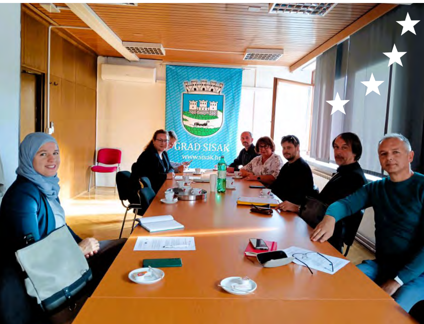
Predstavljanje inicijative za proglašenje Dana raznolikosti predstavnicima Grada Siska

Kako bismo utjecali na javne politike i osigurali da one donose što veću korist za društvo u cjelini, bavimo se javnim zagovaranjem.