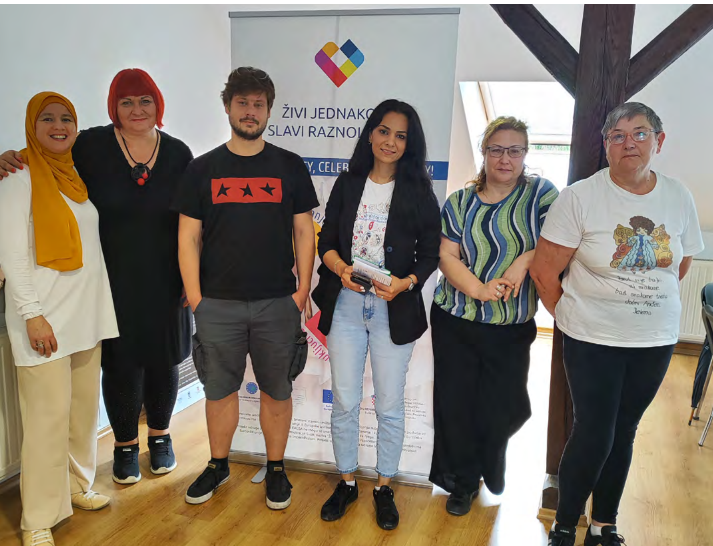
Zajednička fotografija nakon izrade prvog nacrtu zagovaračkog dokumenta inicijative za proglašenje Dana raznolikosti Grada Siska.

Priručnik je nastao i kao nastavak seta aktivnosti jačanja zagovaračkih kapaciteta OCD-ova u Sisačko-moslavačkoj županiji. U ožujku i travnju 2024. godine održane su radionice o jačanju zagovaračkih kapaciteta za OCD-ove u Sisku, a nalazi i preporuke iz radionica uključeni su i u ovaj dokument. Sastoji se od šest tematskih poglavlja: europske vrijednosti u kontekstu javnog zagovaranja, zakonodavni okvir u RH, proces donošenja javnih politika, javno zagovaranje, kako uključiti javnost u zagovaračke inicijative te kako zagovarati prema donositeljima odluka. Nadamo se da će priručnik doprinijeti tome da organizacije civilnog društva u budućnosti budu bolje opremljene za planiranje, provođenje i evaluaciju kampanja zagovaranja koje su u skladu s njihovom misijom.